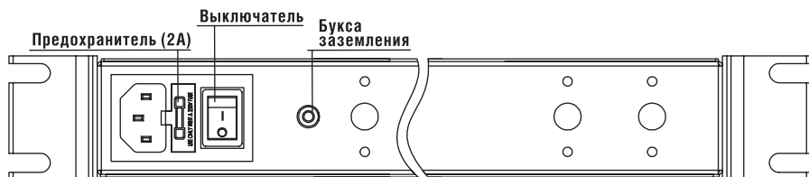
Рисунок 1. Задняя панель оптического передатчика SOT-03

Сетевой выключатель и предохранитель находятся на задней панели (см. рисунок 1).